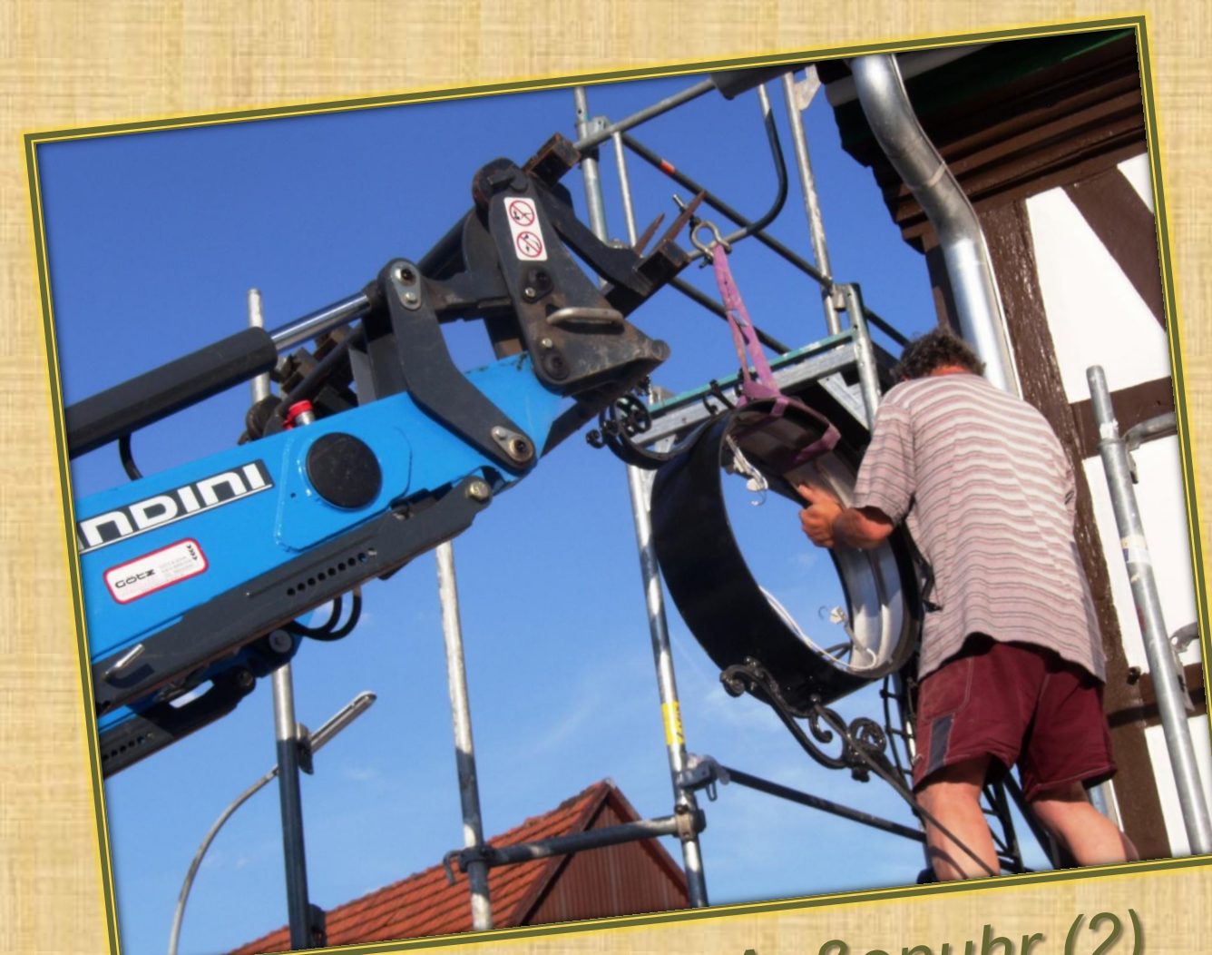
August 2018 Außenuhr (2)