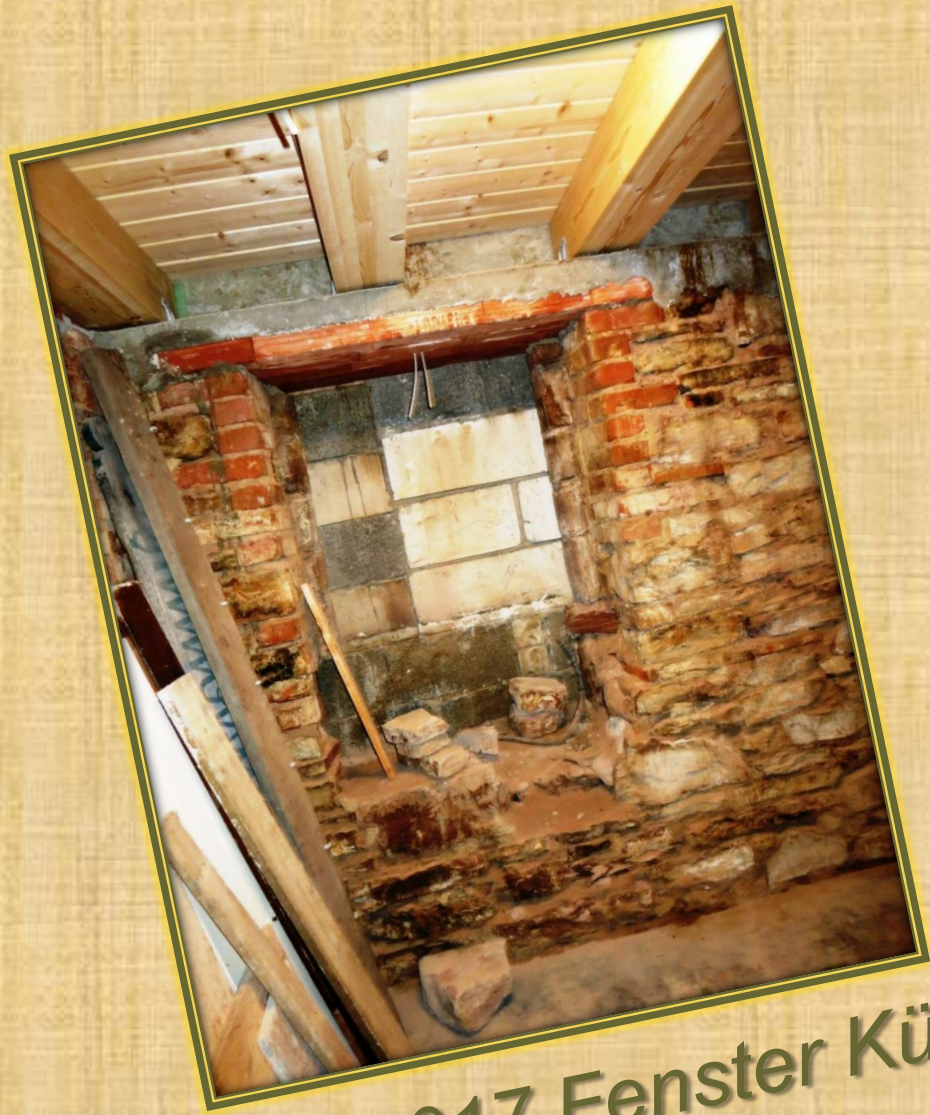
Dezember 2017 Fenster Küche (1)