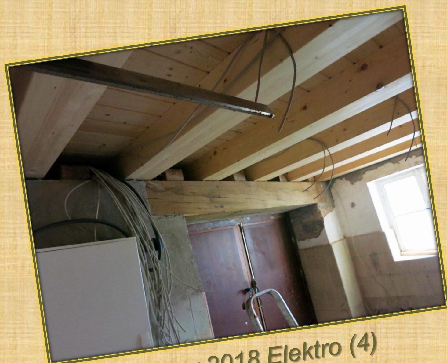
Januar 2018 Elektro (4)