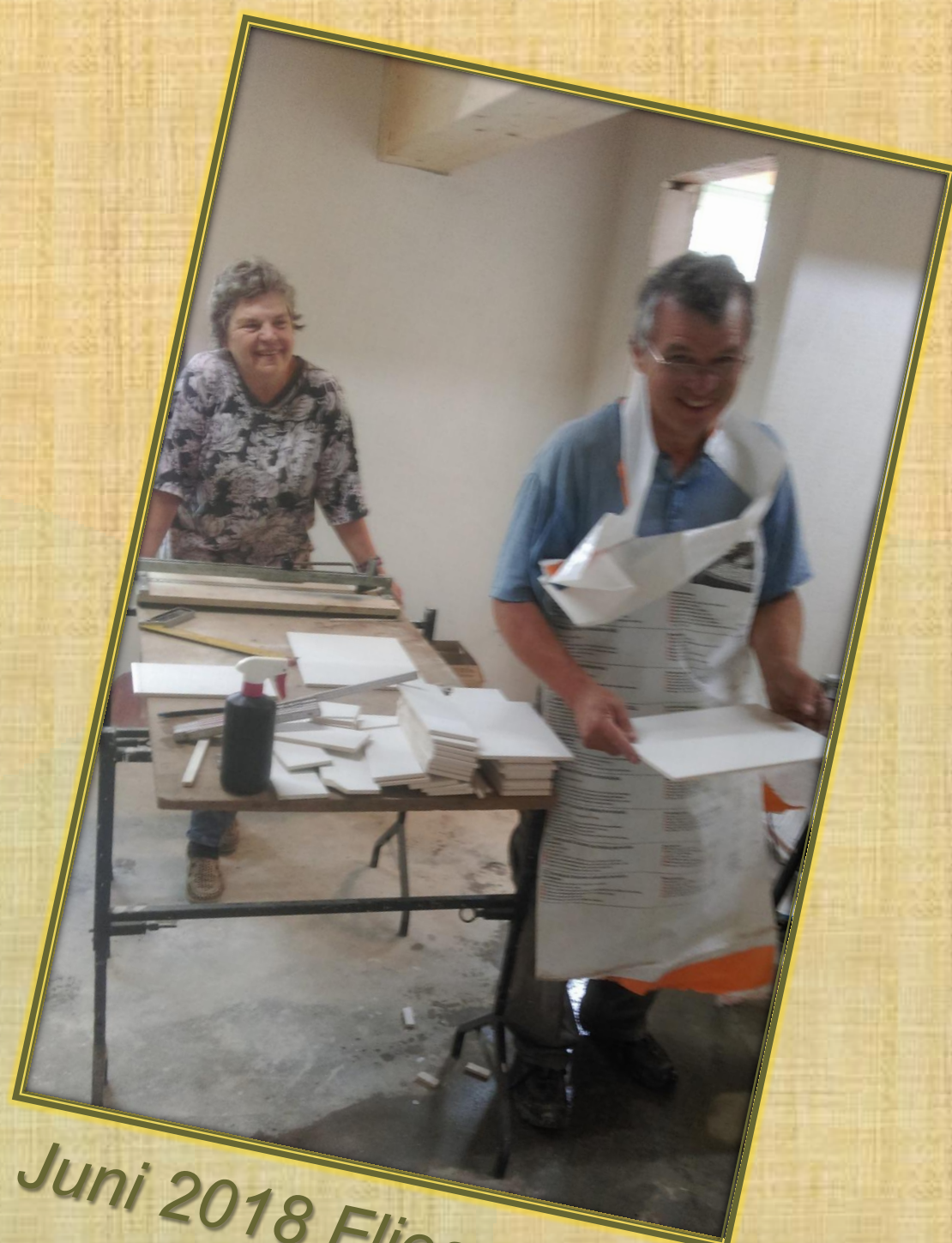
Juni 2018 Fliesen (1)