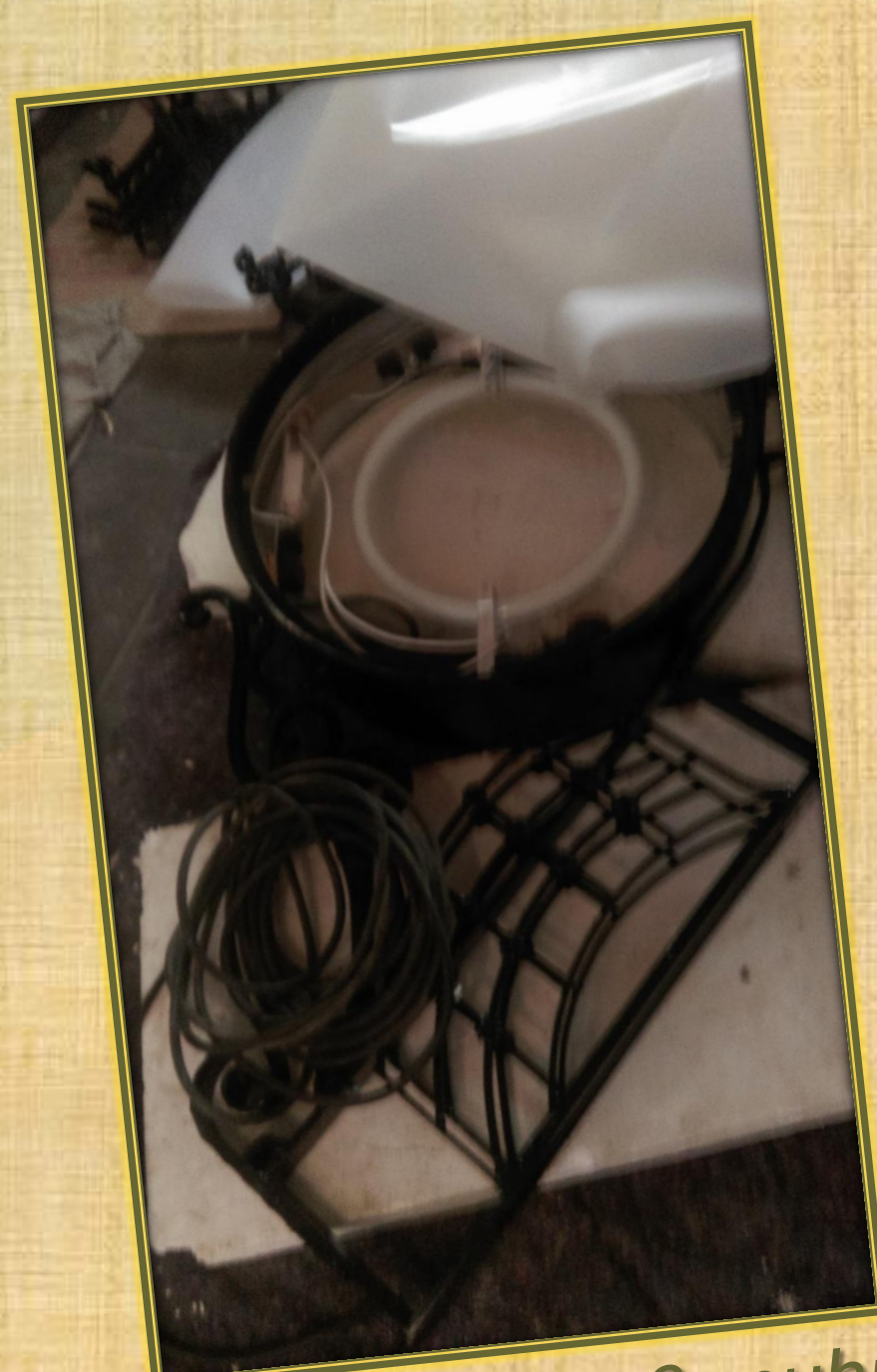
August 2018 Außenuhr (1)