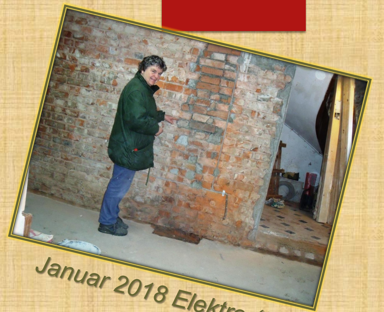
Januar 2018 Elektro (2)