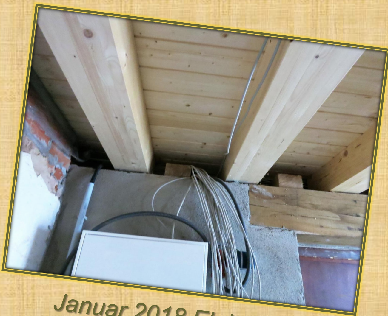
Januar 2018 Elektro (3)