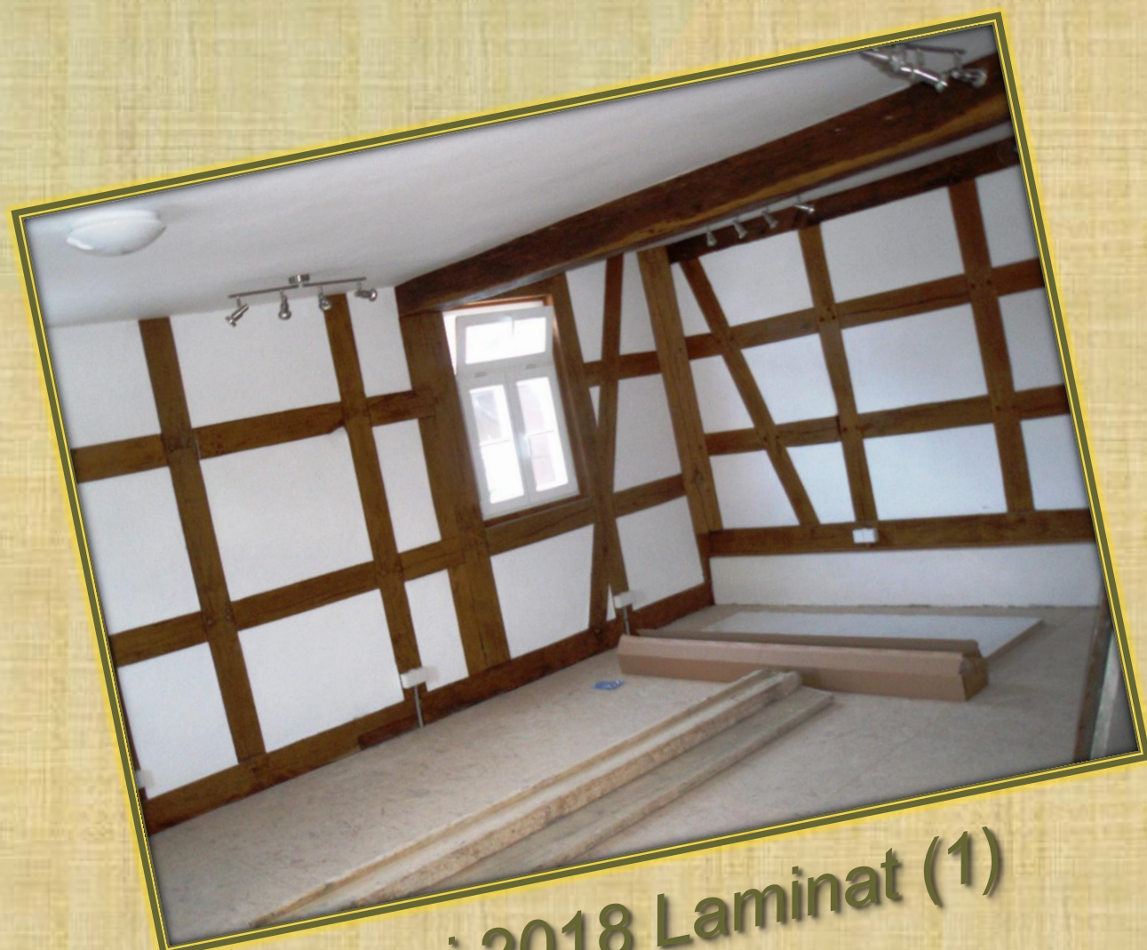
Juni 2018 Laminat (1)