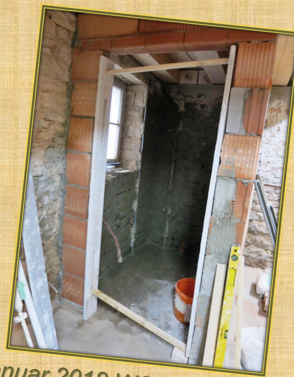
Januar 2018 WC Eingang