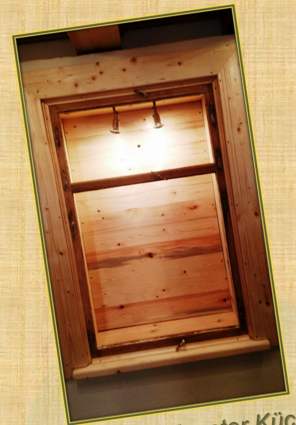
April 2018 Fenster Küche