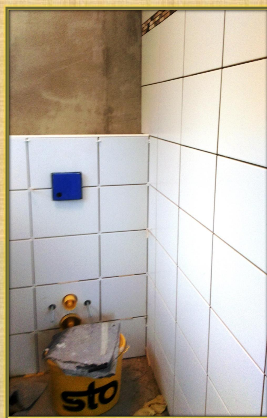
Juni 2018 Fliesen (2)