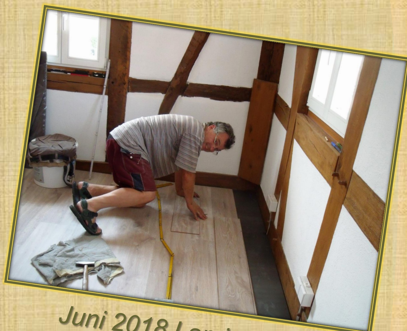
Juni 2018 Laminat (2)