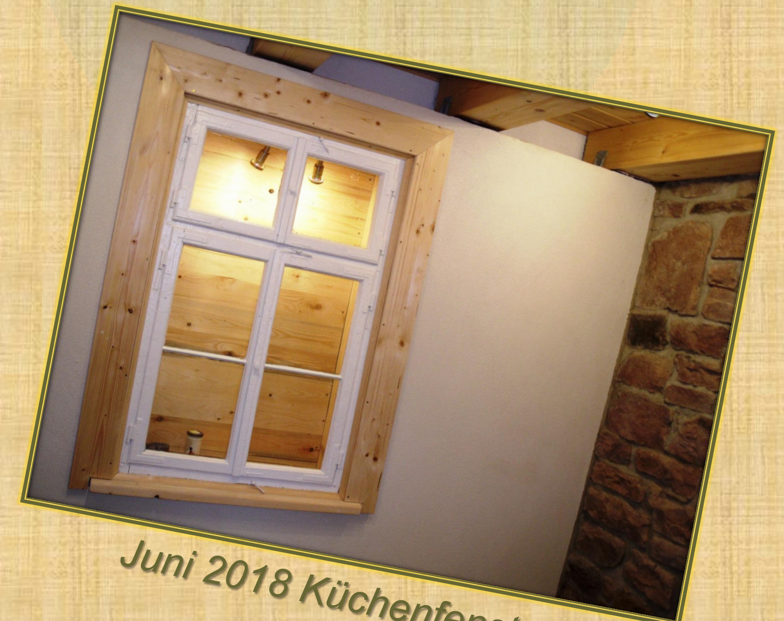
Juni 2018 Küchenfenster