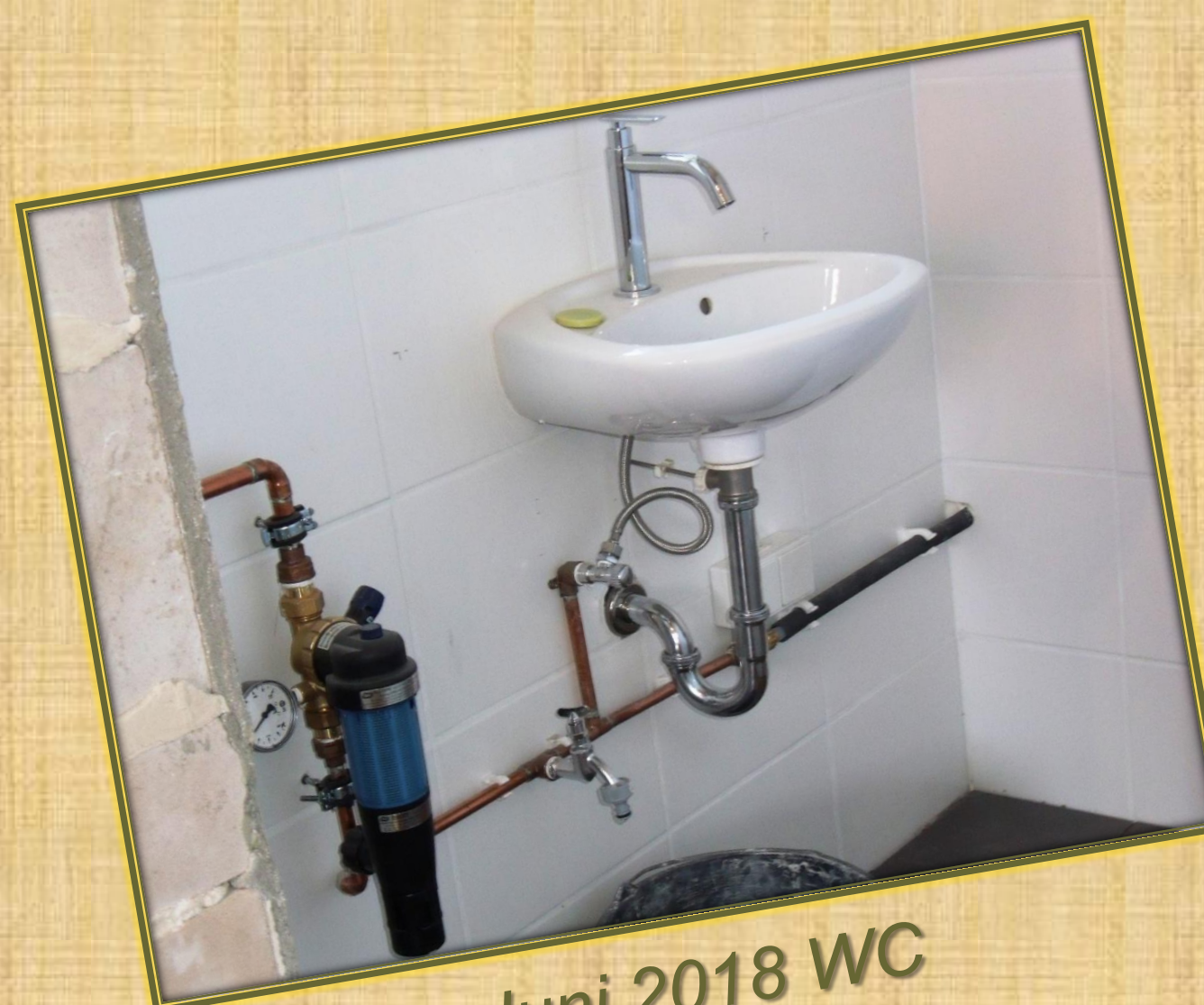
Juni 2018 WC