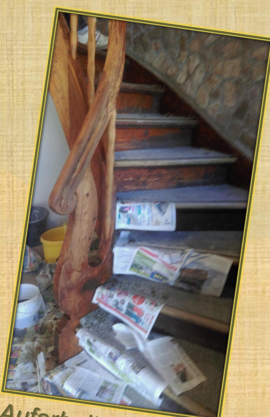
Juli 2018 Aufarbeitung Treppe zum OG