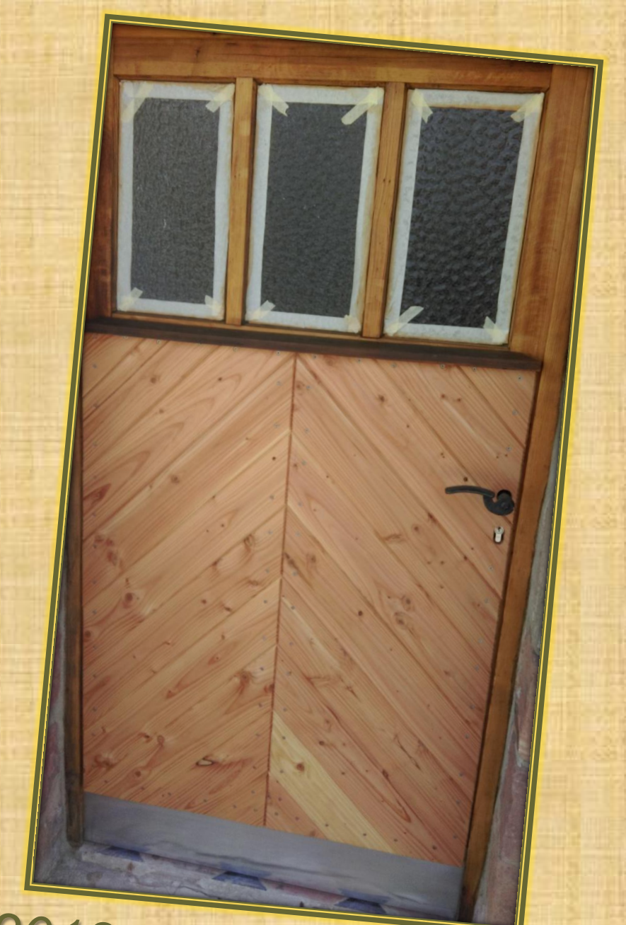
Juli 2018 Aufarbeitung Eingang