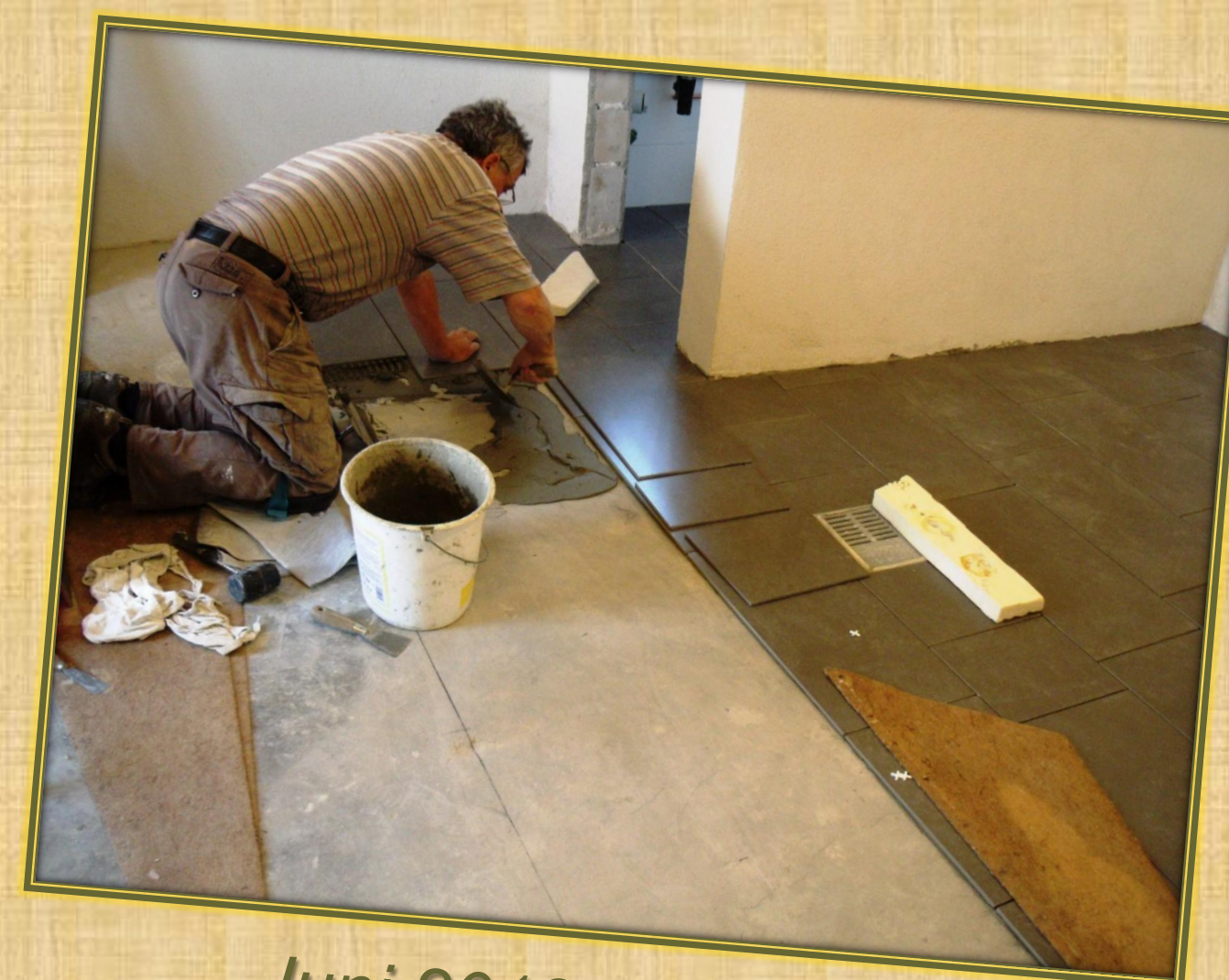
Juni 2018 Fliesen (3)