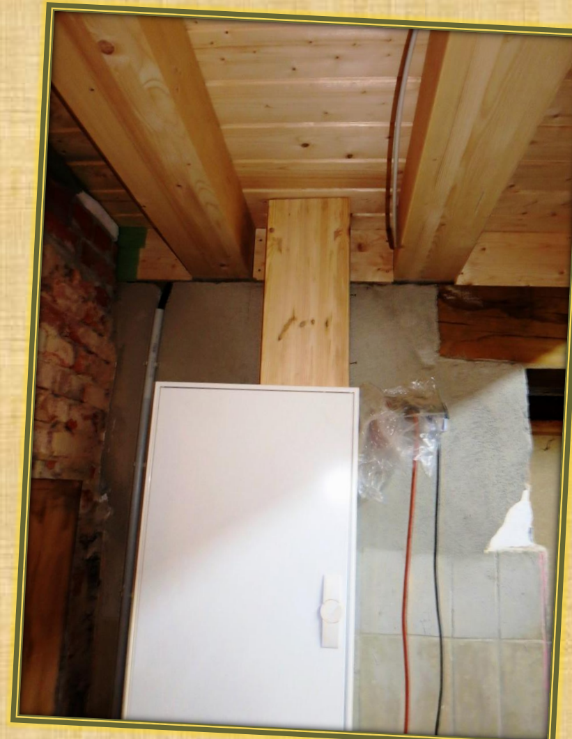
Januar 2018 Elektro (1)