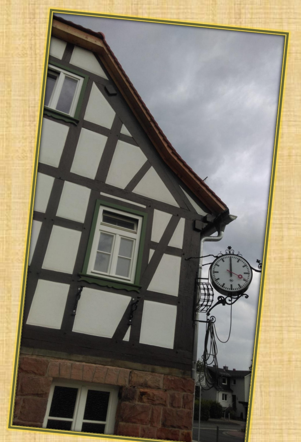
August 2018 Außenuhr (3)