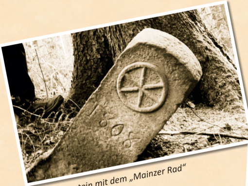
1808: Grenzstein mit dem „Mainzer Rad“