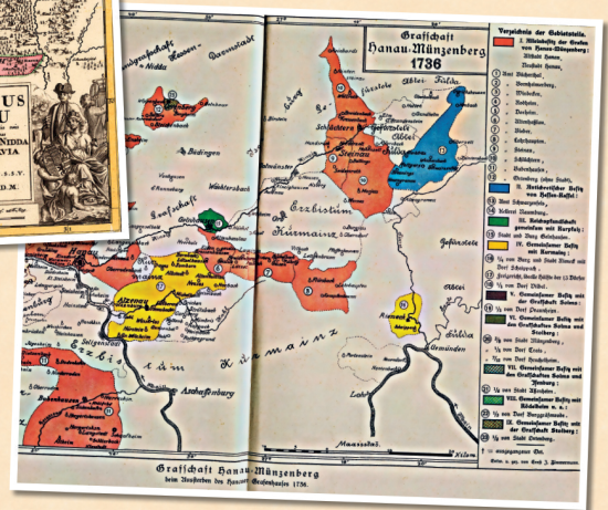
1736: Gebiet der Grafschaft „Hanau - Münzenberg“