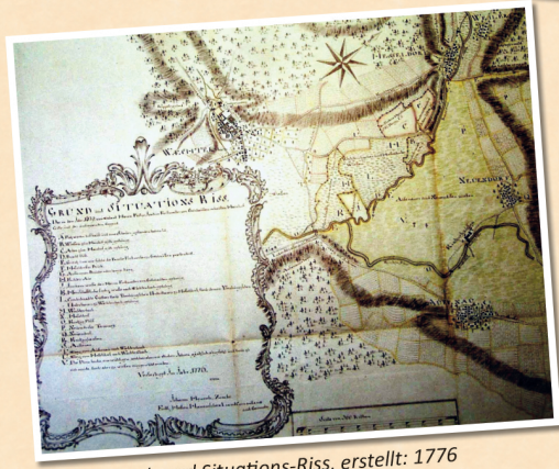
1679: Grund- und Situations-Riss, erstellt: 1776