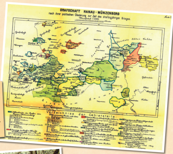
1618 bis 1648: Grafschaft Hanau - Münzenberg während des 30-jährigen Krieges, erstellt: 1886